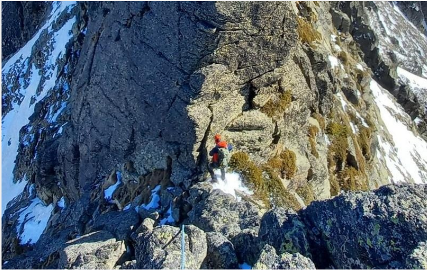
Contrefort (Yann Motte)