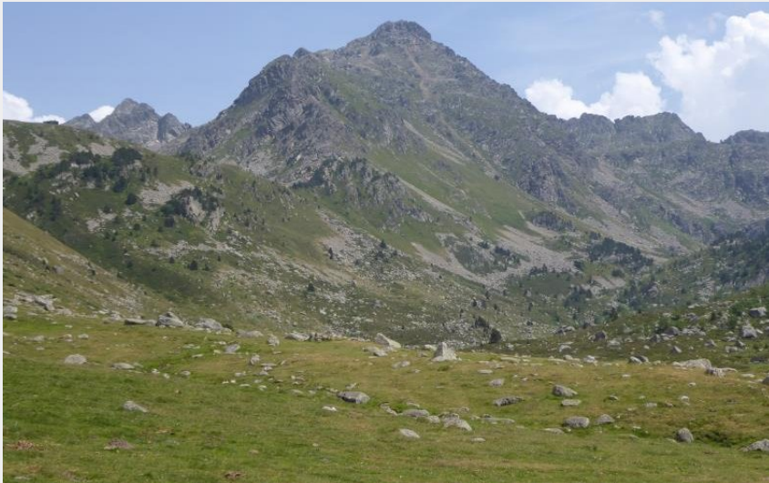
Pic du Rulhe (Damien Rocher)