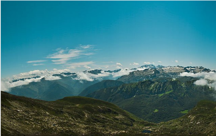
Vue sur la chaîne des Pyrénées, depuis le pics des 3 Seigneurs (Grégory Tonon)